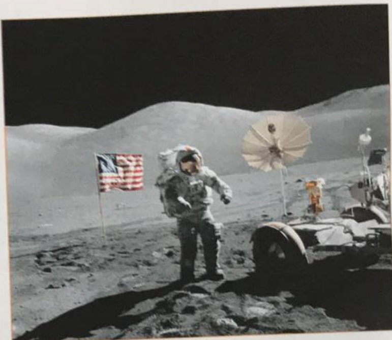
Człowiek na Księżycu