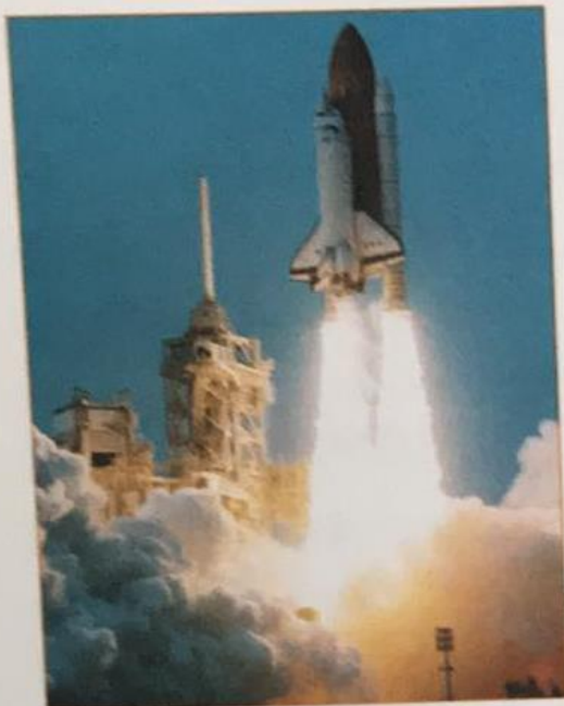
Start promu kosmicznego