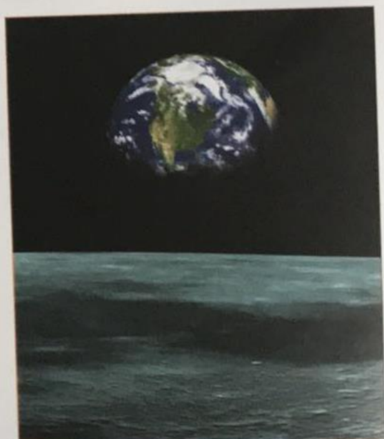
Widok Ziemi z Księżycu